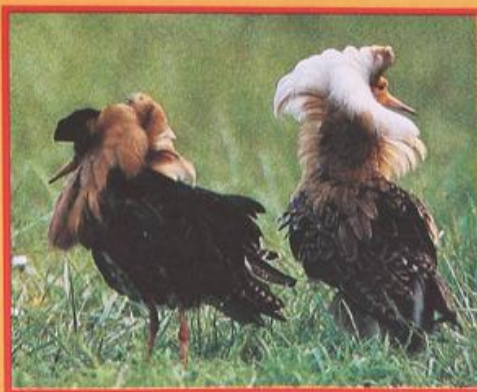
Een satellietman (r) en honkman (l) kijken weg van elkaar om agressie te voorkomen.

Een arena bestaat uit een aantal honken. Dit zijn platgetrapte stukjes gras, of ondiepe kuultjes die op 1 à 1,5 meter van elkaar liggen. De honken worden door zogenaamde honkmannen verdedigd tegen concurrenten. Die concurrentie bestaat uit andere honkmannen en zogenoemde randmannen die geen vast honk hebben en proberen zich een plaats te veroveren. Een randman kan een honkman zijn van een naburige, minder bezochte arena. Honkmannen en randmannen